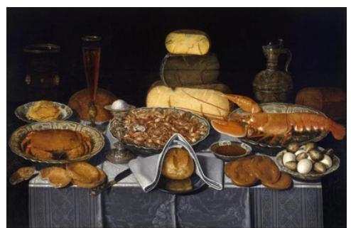
Quadre: "Bodegó amb cranc, gambes i llagosta" - Clara Peeters (1635-40)